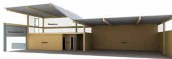
Coupe perspective d'une cellule